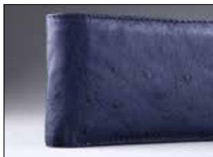
چرم شتر مرغ

چرم سبک: معمولاً به چرم‌هایی گفته می‌شود که از پوست گوسفند، بز و مانند آن به دست می‌آید. نسبت به انواع دیگر چرم نرم‌تر و سبک‌تر است از چرم گوسفندی بیشتر در ساخت پالتو و کاپشن چرم که راحتی در آن اهمیت دارد و از چرم یز بیشتر در ساخت انواع کیف استفاده قرار می‌شود. این نوع چرم چون نرم‌تر است راحت‌تر چروک می‌شود و احتمال آسیب و ساییدگی در آن بیشتر است به همین دلیل نگهداری از آن اهمیت بیشتری دارد.