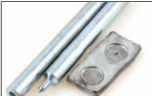
دکمه زن چهار پارچه

مشته و چکش: برای ضربه زدن روی سنبله و ایجاد سوراخ