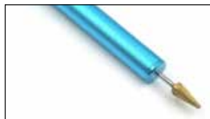
غلتک رنگ لبه نيزه‌ای

غلتک چسب: برای چسب زدن به صورت یکنواخت، پرس کردن و چسباندن چرم روی چرم و فوم و تکسون استفاده می‌شود. به وسیله این غلتک هوای داخل دو لایه خارج شده و لایه‌ها به خوبی روی هم می‌چسبند.