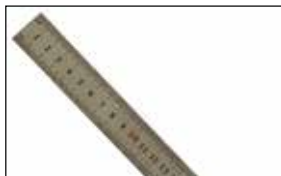
خط کش فلزی

شابلون علامت گذاری: برای علامت گذاری و کشیدن اشکال مختلف روی چرم