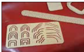
شابلون علامت گذاری

شابلون علامت گذاری: برای علامت گذاری و کشیدن اشکال مختلف روی چرم