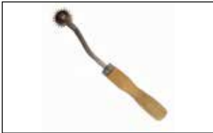
رولت علامت گذاری

استفاده از سنبله یا سوراخ زن را ساده‌تر می‌کند.